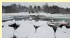
Trångt vid flotten.

Sundet hålls öppet med hjälp av omrörare. Vintertid låser vi inte fast våra båtar då dessa kan behöva flyttas vid behov.